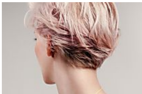
15 Coiffures pour rajeunir de 10 ans (Guide Santé Beauté)