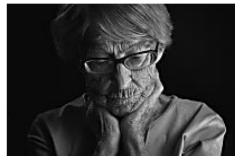
A 105 ans, la secrétaire de Goebbels sort de son silence (L'Obs)