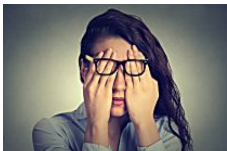
Astuces : comment trouver de bons verres chez votre opticien (Eyezen)