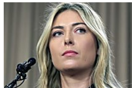
Dopage : suspension réduite pour Sharapova, qui pourra disputer Roland-Garros (Le Monde)