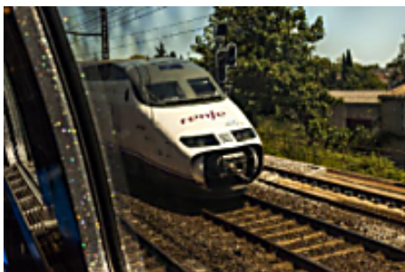
Train franco-espagnol : un grain de sable à la frontière (Le Monde)