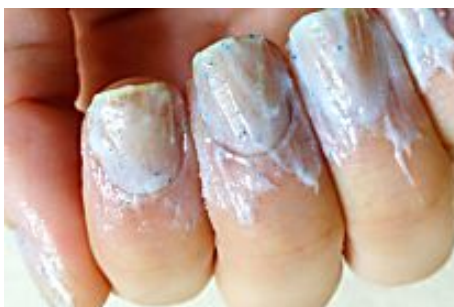
15 Façons Étonnantes d'utiliser du dentifrice (Que Des Astuces)